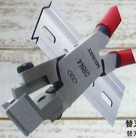
替刃式 替刃品番 RN4